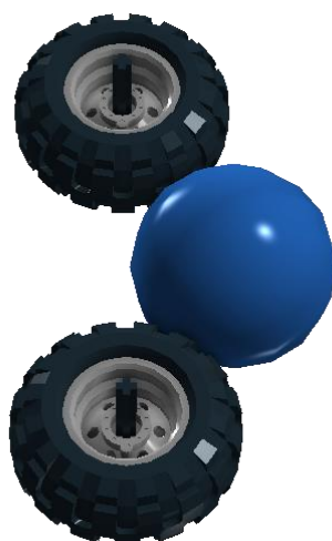
图 6 左右回旋轮方式属“持球”

3.5.6 机器人在射球时，必须能够释放球，有明显的“踢”的动作，否则进球无效。