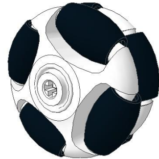
图 4 万向轮