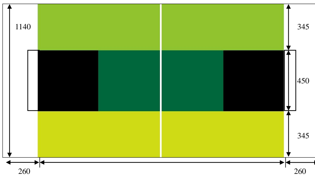
图 1 比赛场地 ( mm )

2.1.2 赛台中央的木质底板上覆盖一层喷绘的背胶场地纸。绿色球场应水平和平整。