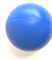
图 3 乐高球