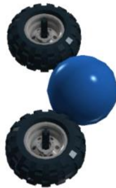
图 6 左右回旋轮方式属“持球”。

3.5.4 机器人如果使用回旋轮的带球装置，则需要注意，不得使用左右回旋轮的方式，这将被定义为“持球”(左右单向双向回旋轮都属于次范围)，如图 6，见规则 5.5。