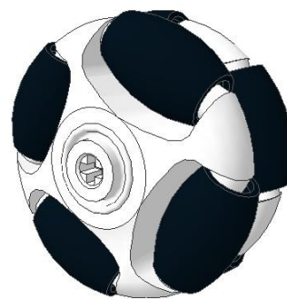
图 4 万向轮