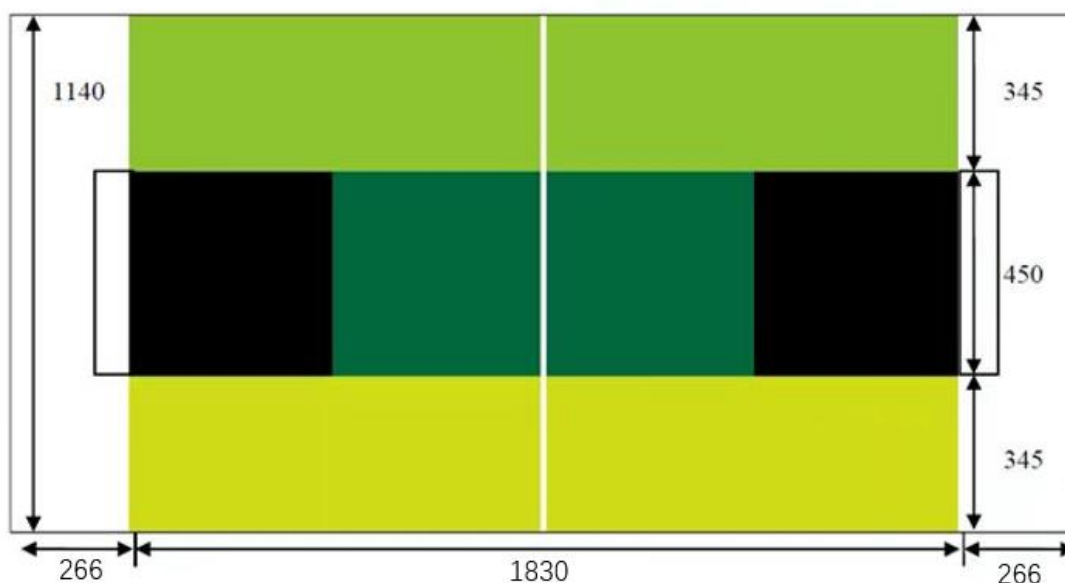
图 1 比赛场地 (mm)

2.1.2 赛台中央的木质底板上覆盖一层喷绘的背胶场地纸。绿色球场应水平和平整。